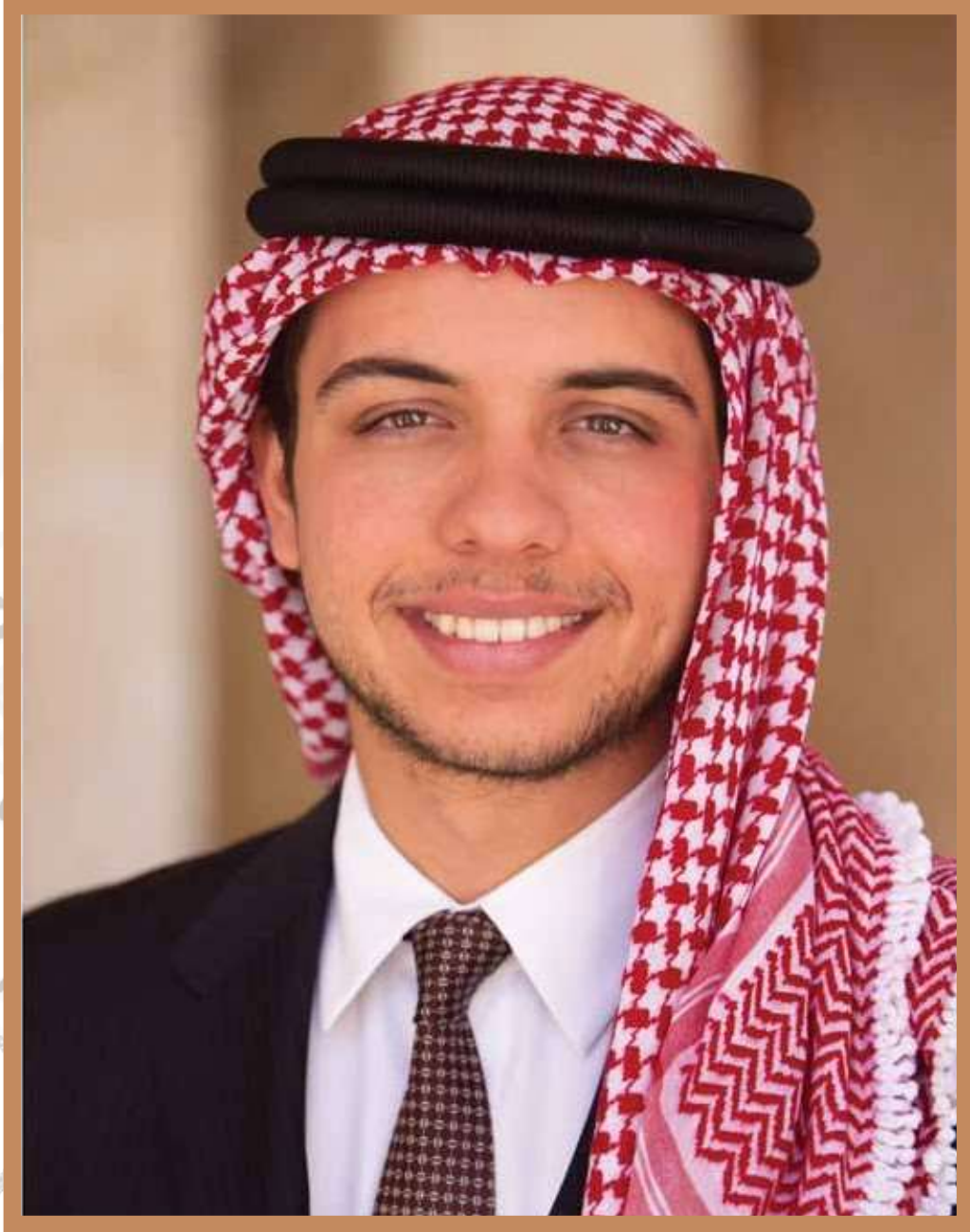
صاحب السمو الملكي ولي العهد الأمير حسين بن عبدالله الثاني المعظم حفظه الله ورعاه