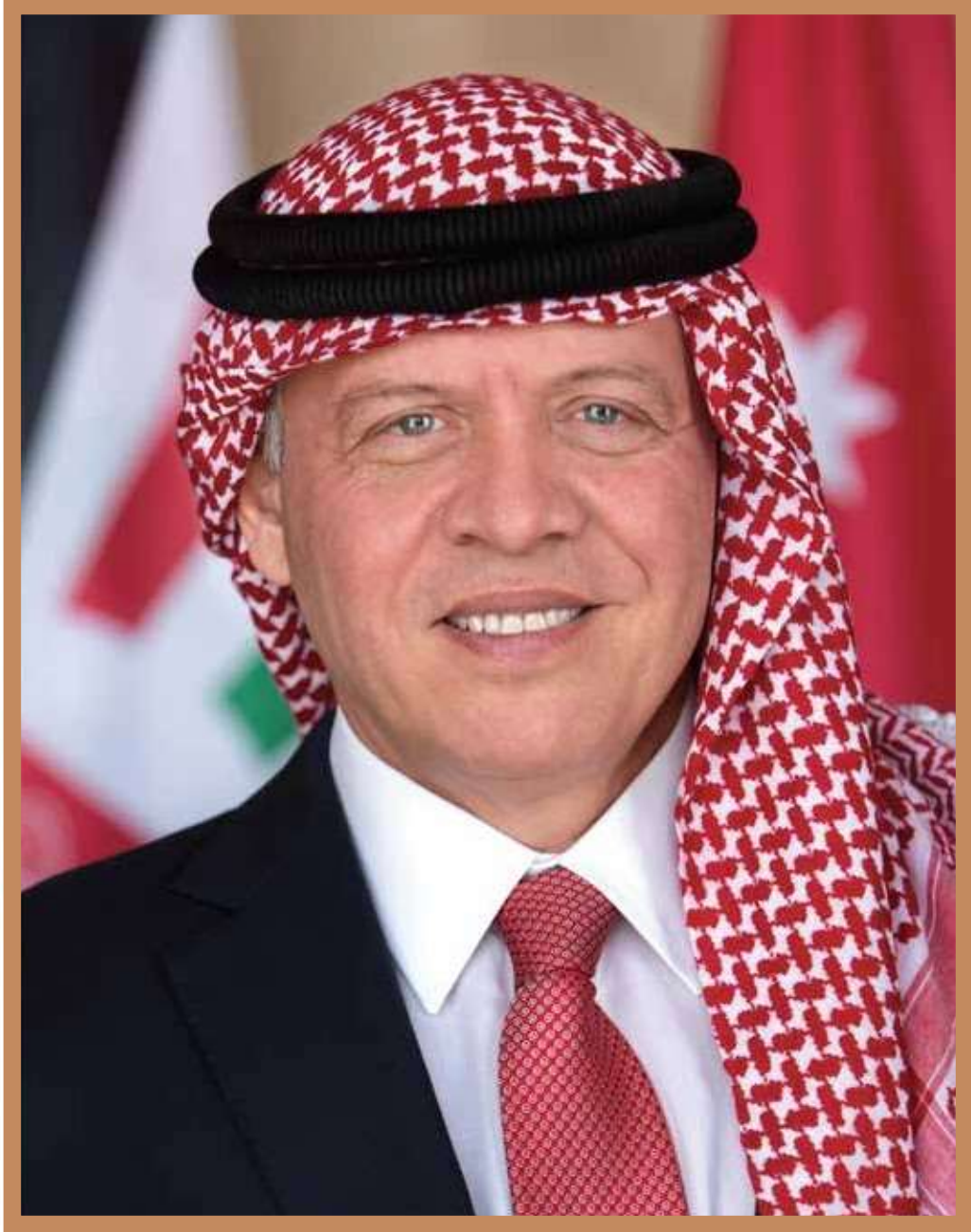
صاحب الجلالة الهاشمية الملك عبدالله الثاني بن الحسين المعظم حفظه الله ورعاه